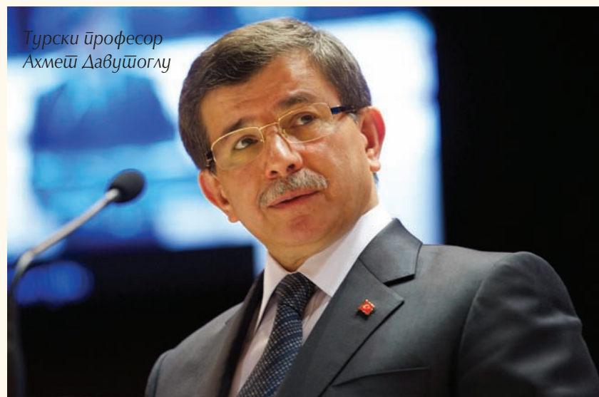
Турски професор Ахмет Давутоглу